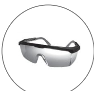
Lunettes de protection