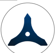
Lame 3 dents