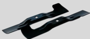
Jeu de lames Réf. : 1111-M6-0149