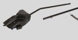
Mulching Réf. : 196-749A678