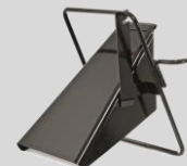
Déflecteur Réf. : 196-750A678