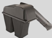
Lame de rechange Réf. : 196-180A699