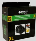
Housse de protection XL Réf. : 2024-U1-0003