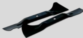
Jeu de lames Réf. : 1111-M6-0147