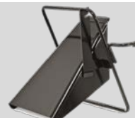
Déflecteur Réf. : 196-750A678