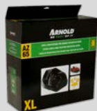
Housse de protection XL Réf. : 2024-U1-0004