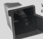
Mulching Réf. : 196-588-678