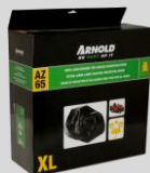
Housse de protection XL Réf. : 2024-U1-0004