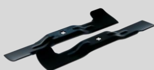
Jeu de lames Réf. : 1111-M6-0149