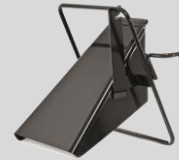
Déflecteur Réf. : 196-750A678