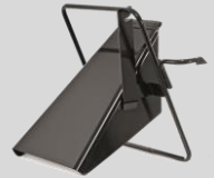
Déflecteur Réf. : 196-750A678