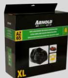
Housse de protection Réf. : 2024-U1-0003