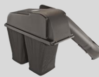
Bac de ramassage Réf. :