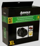
Housse de protection XL Réf. : 2024-U1-0004