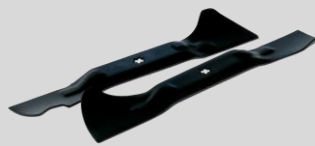
Jeu de lames Réf. : 1111-M6-0147