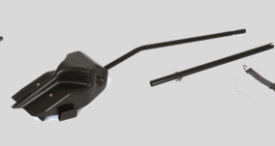
Mulching Réf. : 196-749A678